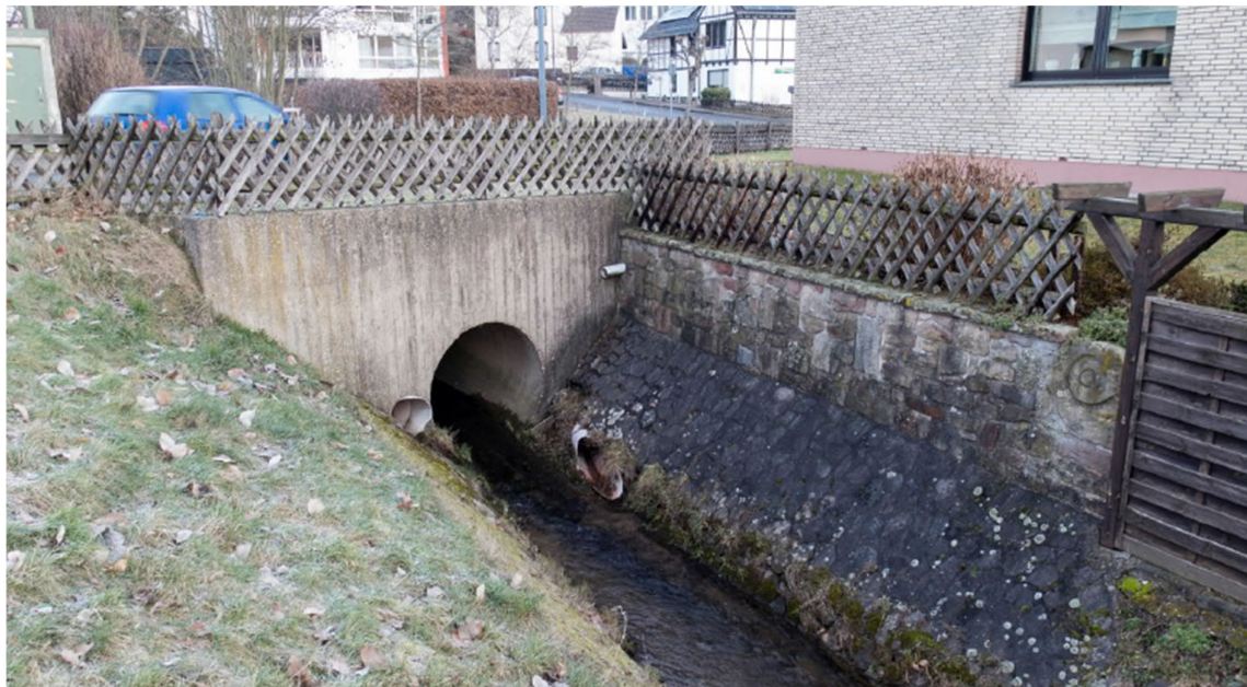
Abbildung 3: Objekt2, Auslauf Durchlass Seestraße – Bestand