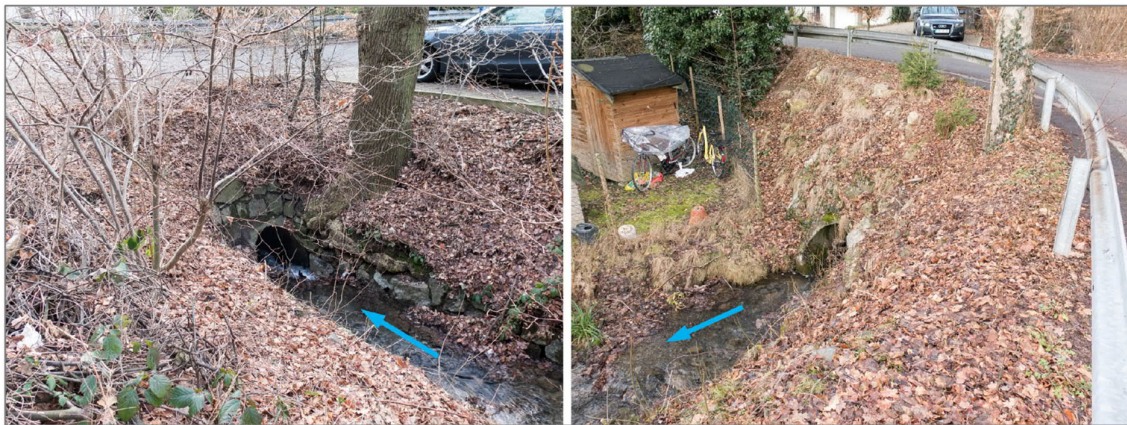
Abbildung 2: Objekt1, Durchlass Steinacker im Bestand – links: Einlauf, rechts: Auslauf – DN 800

Die ausgeschriebenen Leistungen umfassen alle zur vollständigen Realisierung und Dokumentation der Maßnahme notwendigen Planungs-, Ausschreibungs- und Überwachungsleistungen.